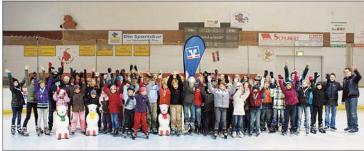
Über 100 Kinder und Jugendliche auf dem Eis mit der Volksbank Eutin im ETC.